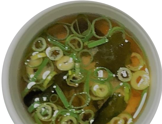
味噌汁わかめ ¥150 (税込)