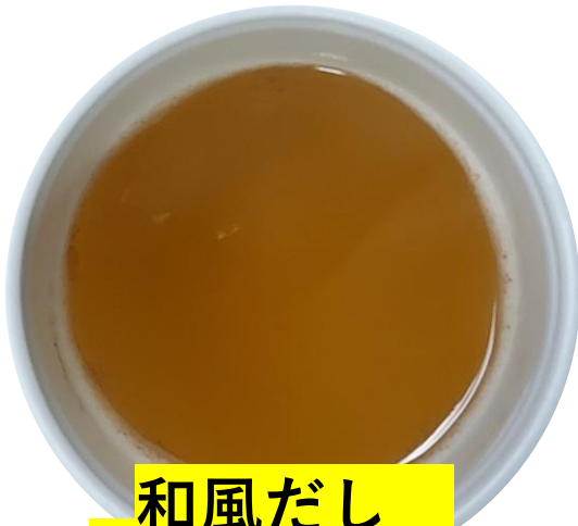
和風だし ¥250 (税込)