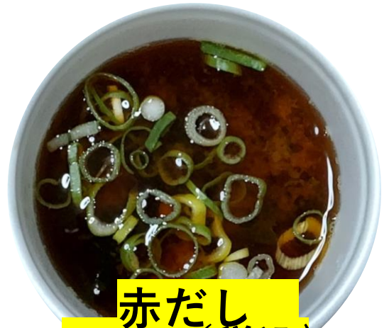
赤だし ¥150 (税込)