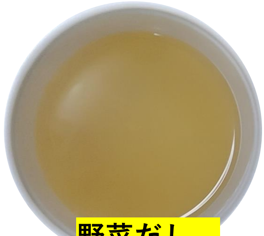
野菜だし ¥250 (税込)