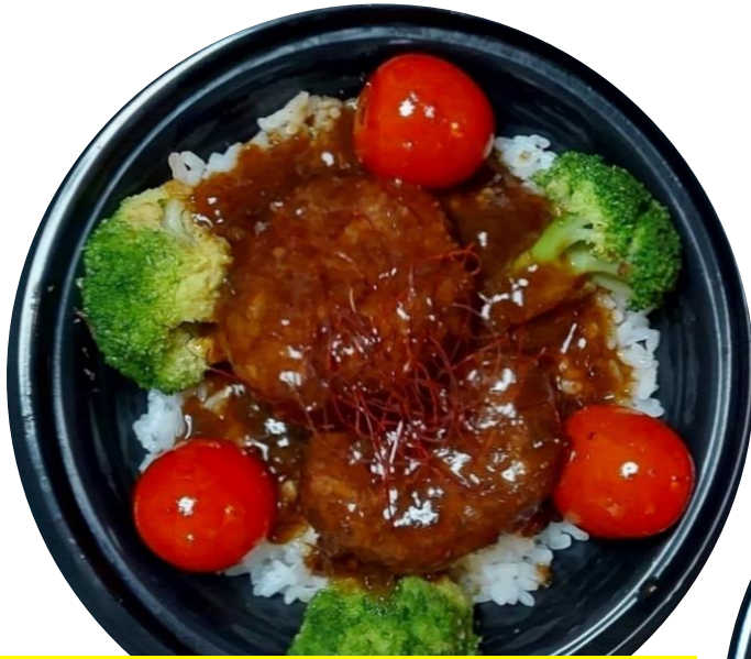
煮込みハンバーグ丼のご飯抜き ¥600 (税込)