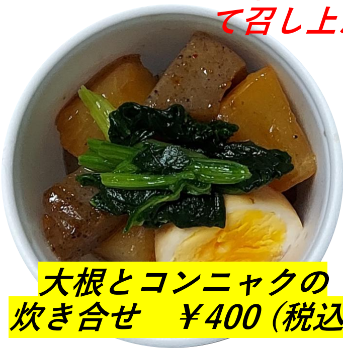
大根とコンニャクの 炊き合せ ¥400 (税込)