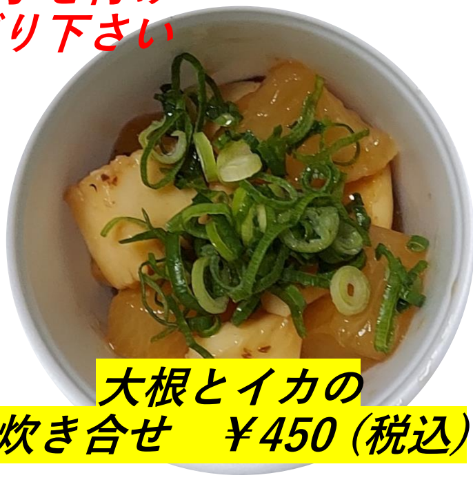
大根とイカの 炊き合せ ¥450 (税込)