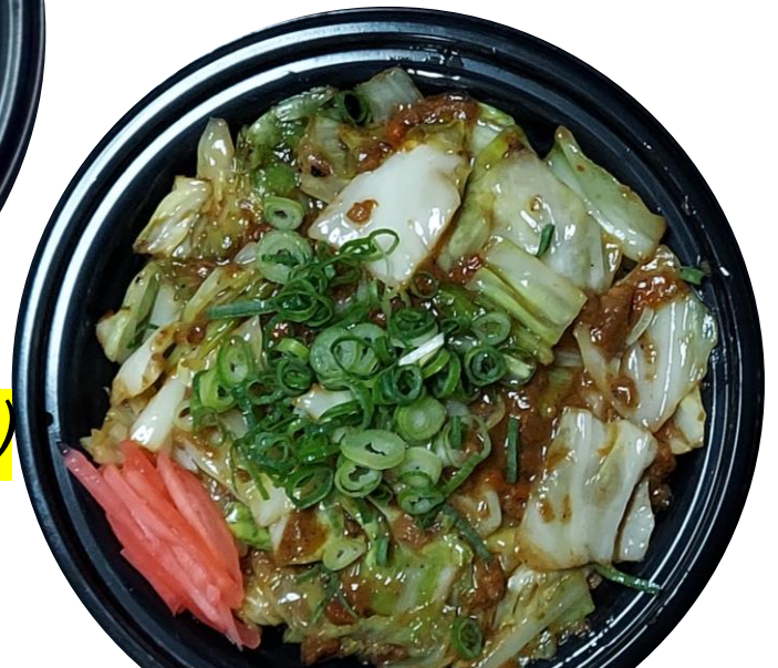
味噌キャベツ丼のご飯抜き ¥450 (税込)

上の写真は一例ですが、他の丼ぶりのご飯抜きも一品料理として丼ぶり価格-150円でご利用頂けます。